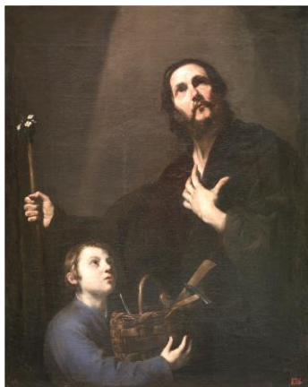
José de Ribera „Św. Józef z Jezusem” olej na płótnie, ok. 1632 Muzeum Prado, Madryt

Mały Jezus niesie kosz, z którego wystają stolarskie narzędzia.