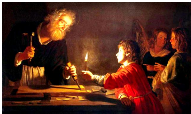
Gerard van Honthorst „Dzieciństwo Jezusa” olej na płótnie, ok. 1620 Ermitaż, Sankt Petersburg

Widzimy więc, jak Jezus pomaga Józefowi, ucząc się od niego zawodu. Józef został przedstawiony, zgodnie z tradycją, jako człowiek już niemłody. Chociaż nie patrzy na Jezusa, widać, że obu łączy bardzo mocna więź. Artysta osiągnął to wrażenie, oświetlając blaskiem świecy jednakowo dwie twarze: pełne miłości oblicze Jezusa oraz dobrotliwą i łagodną twarz Józefa.