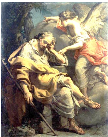
Gaetano Gandolfi, „Sen Józefa” olej na płótnie, ok. 1790; prywatna kolekcja

W trzecim śnie Józef dowiedział się, że może już wracać z Egiptu i ma osiedlić się w Nazarecie.