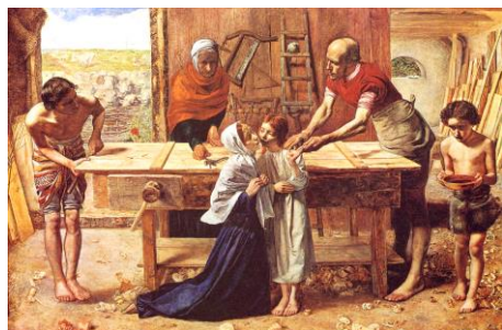
John Everett Millais „Chrystus w domu rodziców” olej na płótnie, 1849–1850 Tate Gallery, Londyn

Obraz spotkał się z bardzo krytycznymi opiniami za „nadmierny realizm”. Uważano, że przedstawienie Świętej Rodziny jako ludzi biednych i prostych jest niewłaściwe, nazywano to nawet profanacją. Szczególnie ostro wypowiadał się słynny pisarz Karol Dickens, który porównał zabrudzone wnętrze warsztatu św. Józefa do najgorszych spelunek.