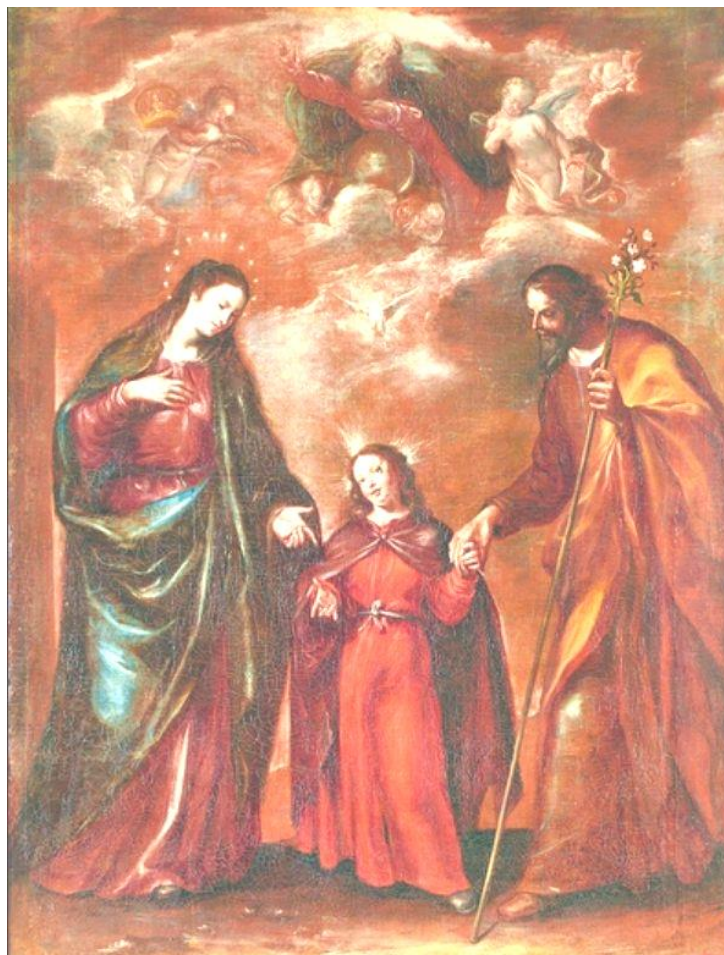
Francisco Camilo Święta Rodzina i Święta Trójca olej na płótnie, XVII w. Muzeum Prado, Madryt